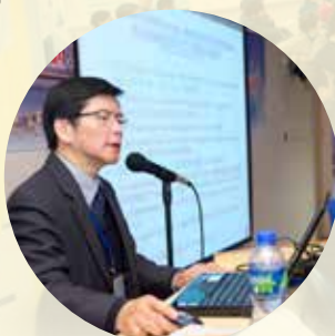
香港衛生署胸肺科主任顧問醫生譚卓明醫生的經驗分享