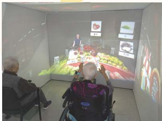
模擬乘搭地鐵場景

利用VR系統為院友提供長者虛擬實景體驗。帶院友們回到他們以往生活的場景，例如：街市、超級市場、交通工具等，並且可參與其中，達到懷緬治療的效果，由於虛擬場景仿真度高，院友們都玩得非常投入。