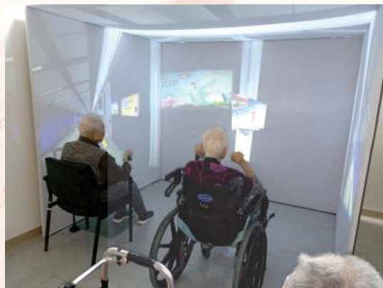
模擬街市購物場景