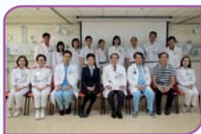
▲胸肺內科部及專職醫療服務團隊